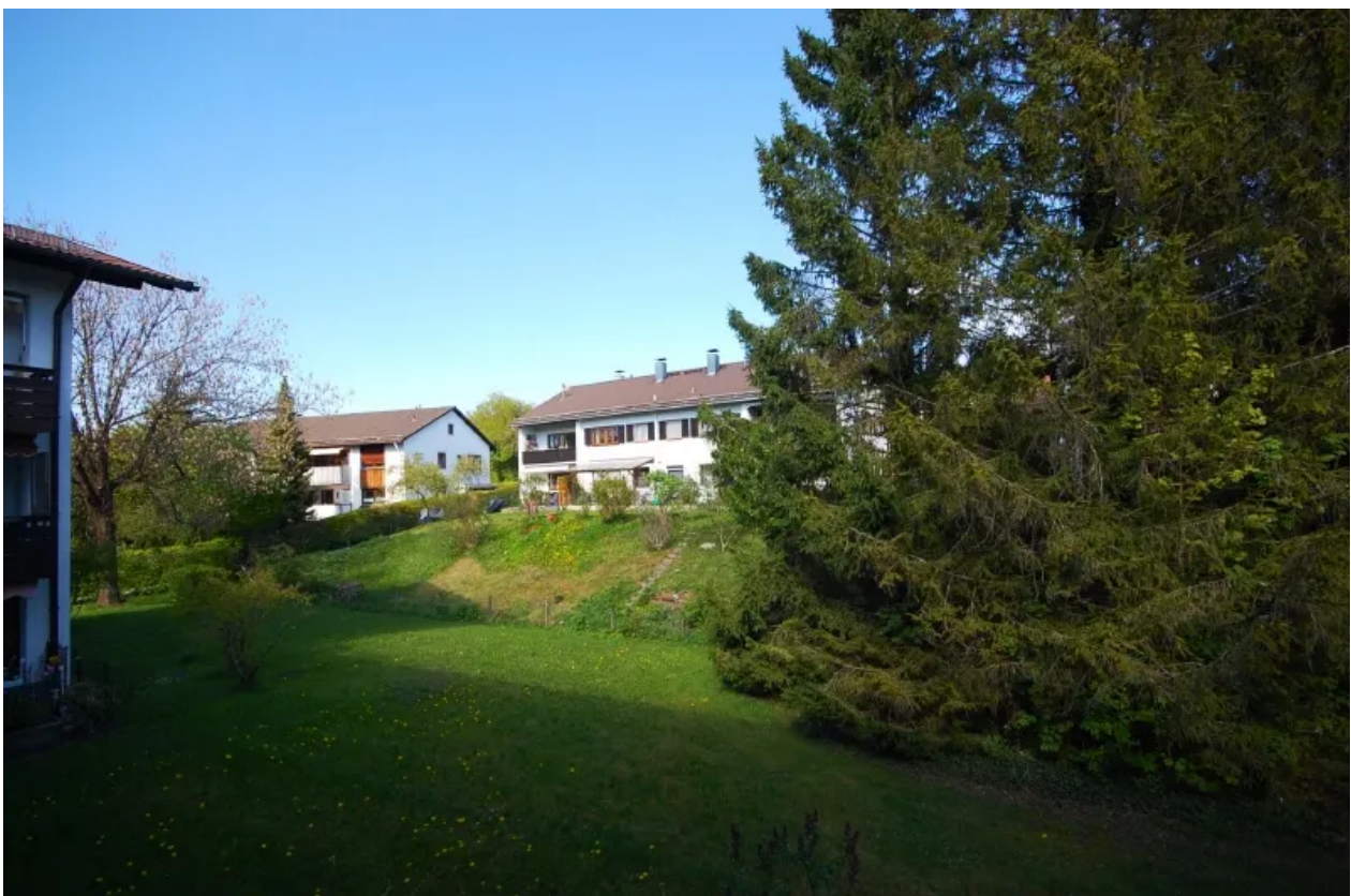
Blick vom Balkon Ostseite