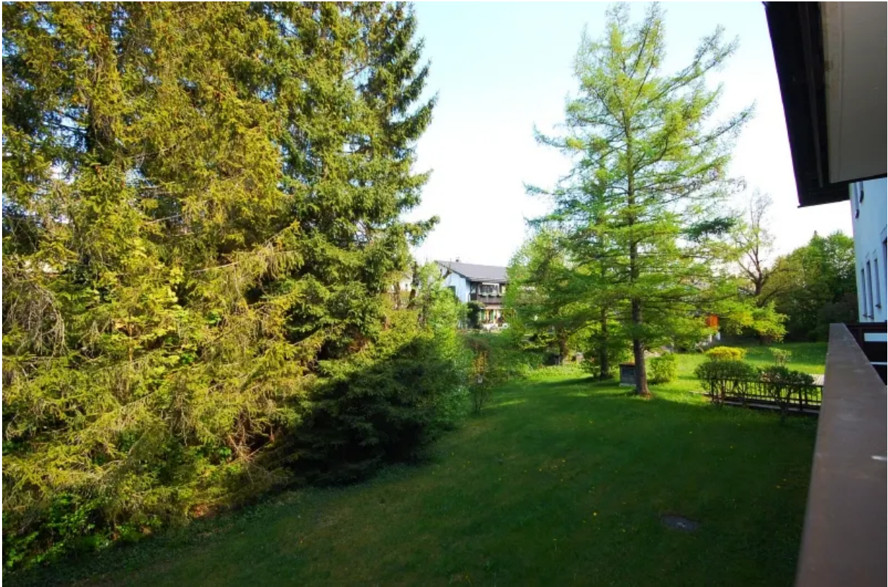
Ausblick vom Ostbalkon