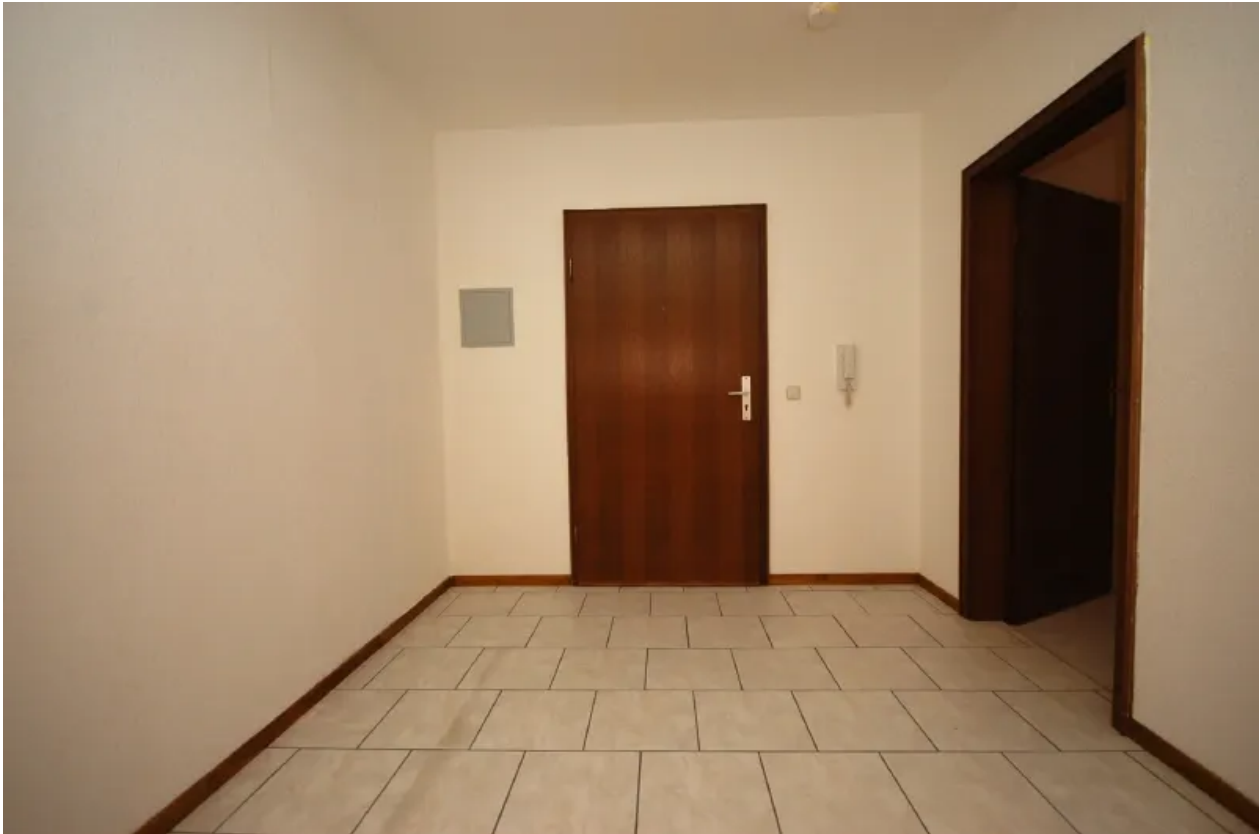
Eingang, Flur, Garderobe